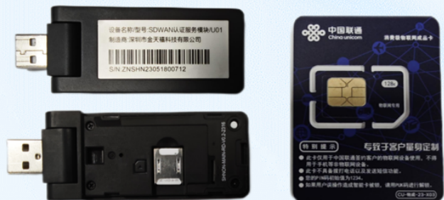
工信部认证U盾及物联网卡